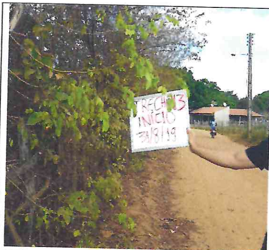
TRECHO 13 – 31/08/2019