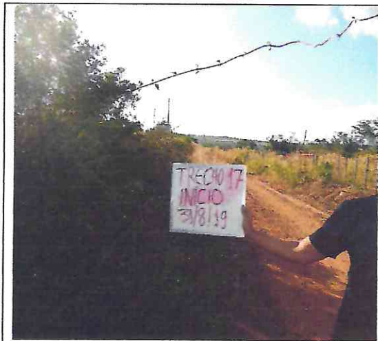
TREHO 17 – 31/08/2019