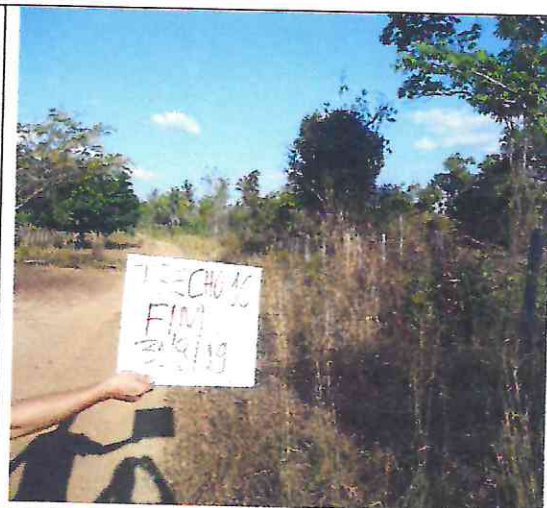
TRECHO 16 – 31/08/2019