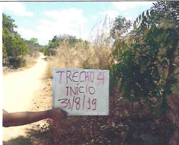
TRECHO 4 – 31/08/2019