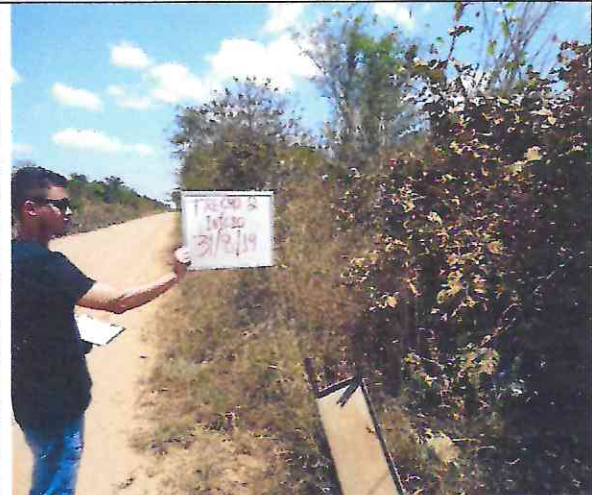
TRECHO 2 – 31/08/2019