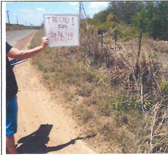
TRECHO 1 – 31/08/2019