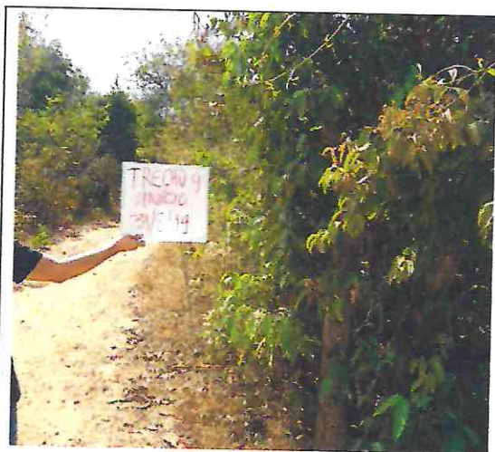
TRECHO 9 – 31/08/2019