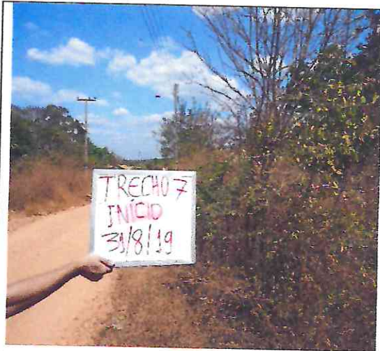
TRECHO 7 – 31/08/2019