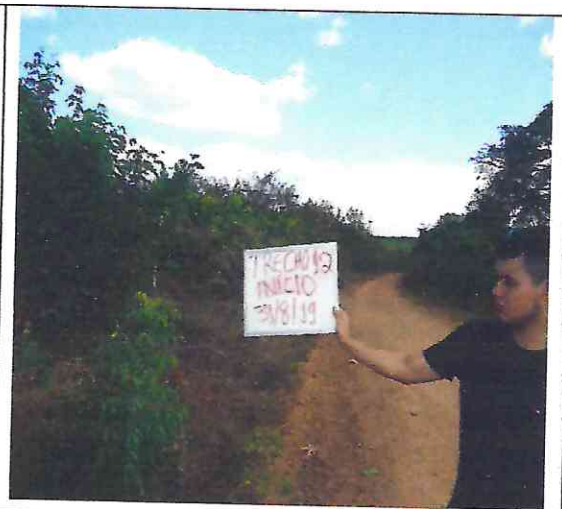
TRECHO 12 – 31/08/2019