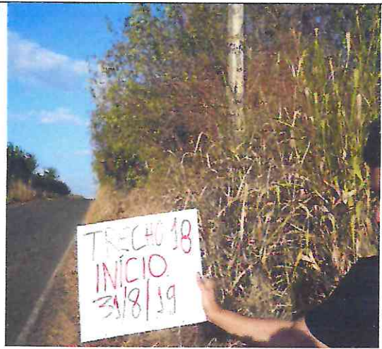
TRECHO 18 – 31/08/2019