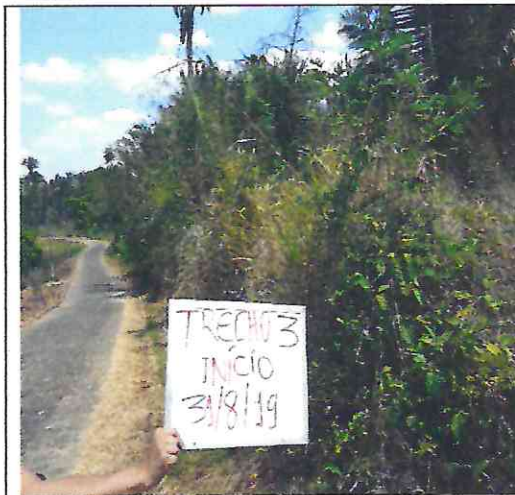
TRECHO 3 – 31/08/2019