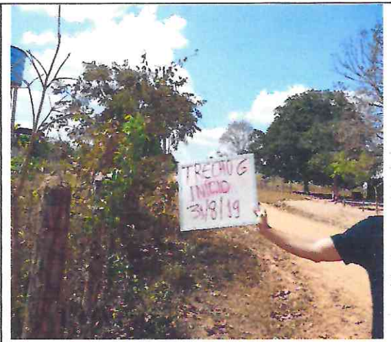
TRECHO 6 -31/08/2019