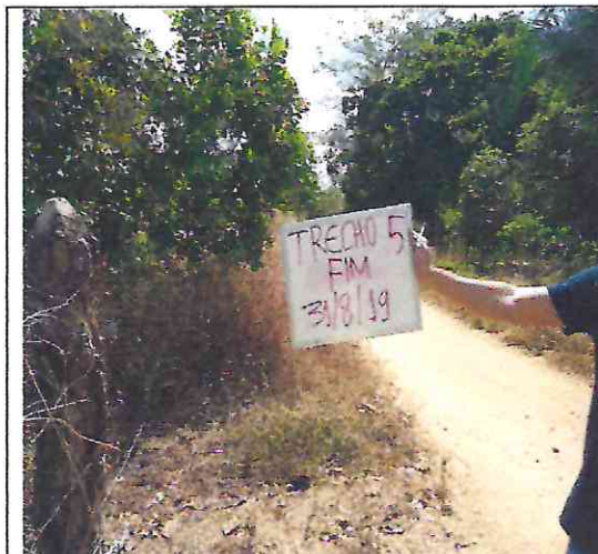
TRECHO 5 – 31/08/2019